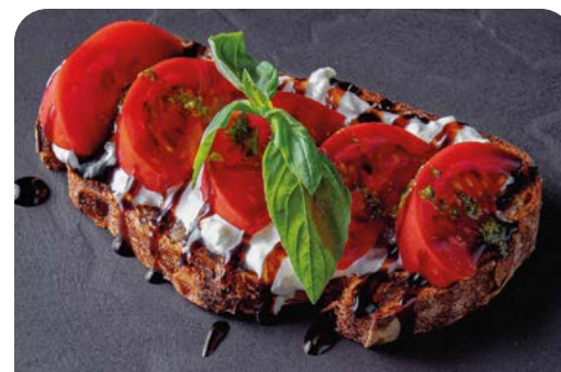
БРУСКЕТТА С ТОМАТАМИ И СТРАЧАТЕЛЛОЙ

130 г ..... 790 Семга со страчателлой, авокадо и каперсами на гречишном хлебе.