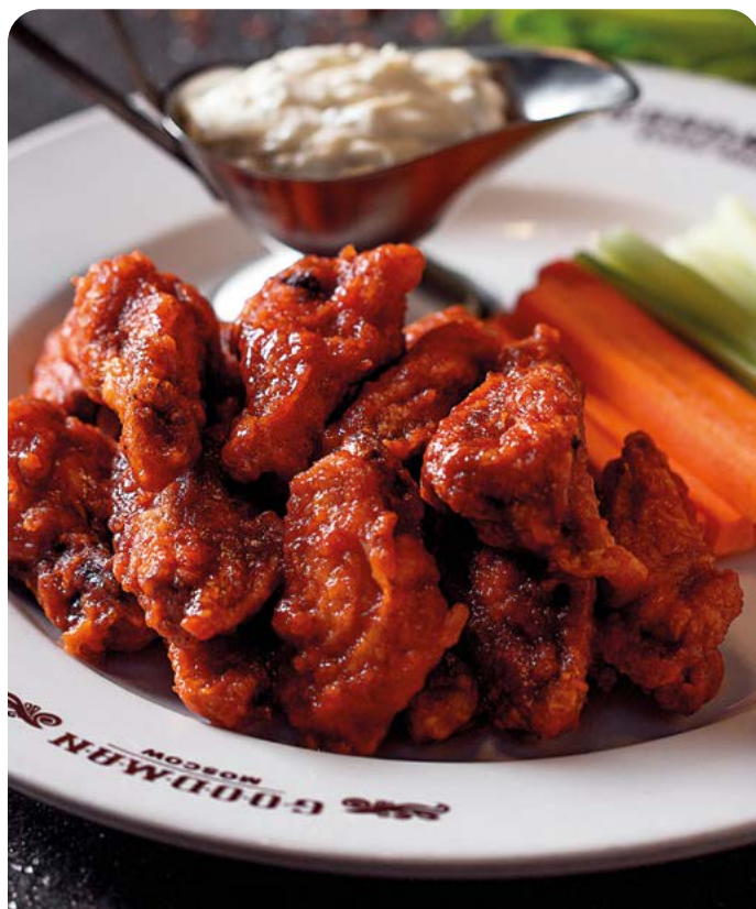
КУРИНЫЕ КРЫЛЬЯ XL CHICKEN WINGS XL

490/100/50 г ..... 1200 В глазури «Барбекю». Подаются со свежей морковью, сельдереем и соусом «Блю чиз».