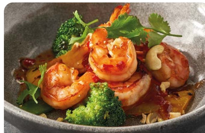
КРЕВЕТКИ В АЗИАТСКОМ СТИЛЕ SHRIMP IN ASIAN STYLE

2 шт./35/30 г ..... 890 Приготовленные в соусе BBQ. С медовым чесноком и карамельным луком. Подаются с пряным соусом и бездрожжевым хлебом.