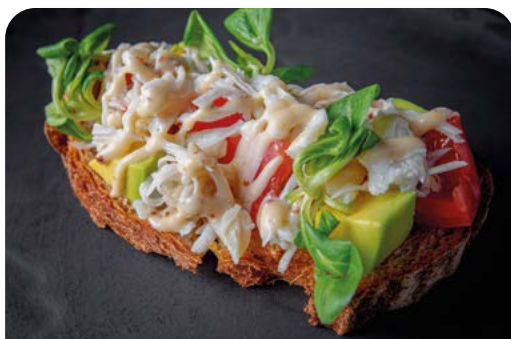
БРУСКЕТТА С КРАБОМ BRUSCHETTA WITH CRAB

125 г ..... 870 Обжаренный на гриле гречишный хлеб с краб-миксом, сочными томатами и авокадо под медово-горчичным соусом.