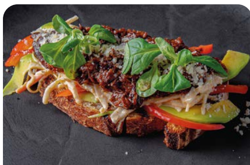
БРУСКЕТТА С ТОМЛЕННОЙ ГОВЯДИНОЙ BRUSCHETTA WITH STEWED BEEF

BRUSCHETTA WITH TOMATOES AND STRACHATELLA 125 г ..... 590 Сладкие томаты со страчателлой, соусами песто и бальзамик на гречишном хлебе.