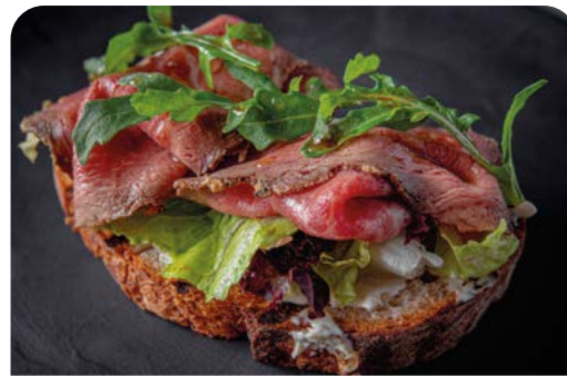
БРУСКЕТТА С РОСТБИФОМ BRUSCHETTA WITH ROAST BEEF

145 г ..... 690 Нежное мясо говяжьих щечек мраморных бычков с салатом «Коул-Слоу» и перцем гриль, авокадо и пармезаном.