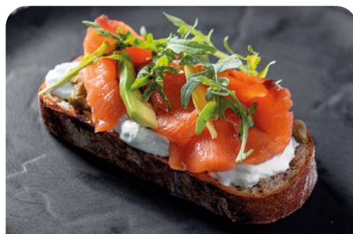
БРУСКЕТТА СО СЛАБОСОЛЕННОЙ СЕМГОЙ BRUSCHETTA WITH LIGHTLY SALTED SALMON

125 г ..... 870 Обжаренный на гриле гречишный хлеб с краб-миксом, сочными томатами и авокадо под медово-горчичным соусом.