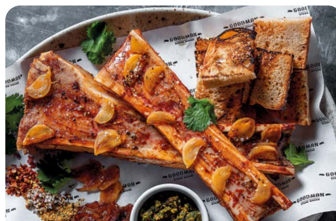
МОЗГОВЫЕ КОСТОЧКИ НА ГРИЛЕ GRILLED MARROW BONES

290/100/30 г ..... 790 В глазури «Барбекю». Подаются со свежей морковью, сельдереем и соусом «Блю чиз».