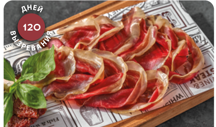
СЫРОВАЯ МРАМОРНАЯ ГОВЯДИНА* MARBLE BEEF PARMA

70/40 г ..... 990 Мраморная говяжья вырезка с руколой, пармезаном, каперсами под трюфельной заправкой.