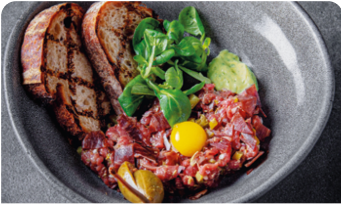
ФИРМЕННЫЙ ТАРТАР «ГУДМАН» GOODMAN BRANDED TARTARE

90/60 г ..... 850 Тартар из мраморной и сыровяленой говядины с перепелиным яйцом. Подается с гречишным хлебом и соусом айоли с халапеньо.