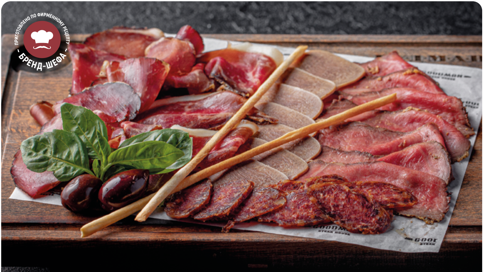
МЯСНОЕ АССОРТИ MEAT PLATTER

50/50 г ..... 950 С сыром дорблю, вялеными томатами, маслинами каламата.