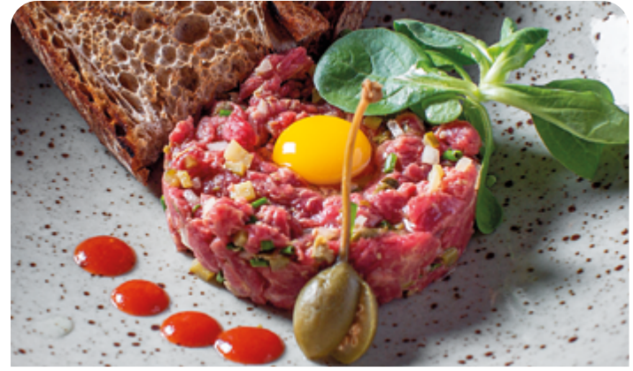
ТАРТАР ИЗ ГОВЯДИНЫ BEEF TARTARE

90/60 г ..... 850 Тартар из мраморной и сыровяленой говядины с перепелиным яйцом. Подается с гречишным хлебом и соусом айоли с халапеньо.