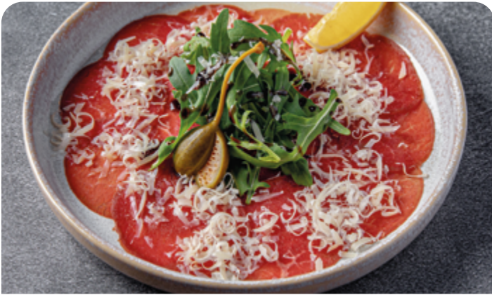
КАРПАЧЧО ИЗ ГОВЯДИНЫ BEEF CARPACCIO

90/50 г ..... 780 Классический тартар из говядины с перепелиным яйцом и гречишным хлебом. Подается с острым соусом по желанию.